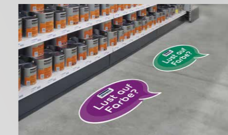
Deko-Set für Schaufenster und Ladengeschäft