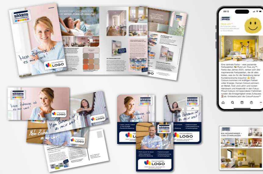
Anzeigen, Mailings und Zeitungsbeilagen